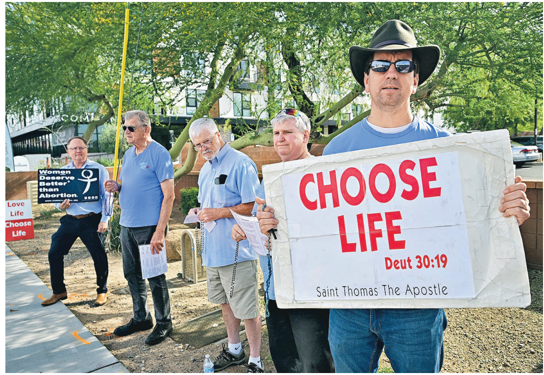
反墮胎 今年4月在阿利桑那州鳳凰城，有民眾在墮胎診所外手持寫有「選擇生命」的牌子，反對婦女墮胎。