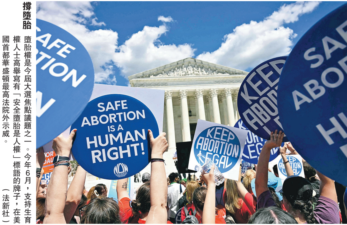
撐墮胎 墮胎權是今屆大選焦點議題之一。今年6月，支持生育權人士高舉寫有「安全墮胎是人權」標語的牌子，在美國首都華盛頓最高法院外示威。