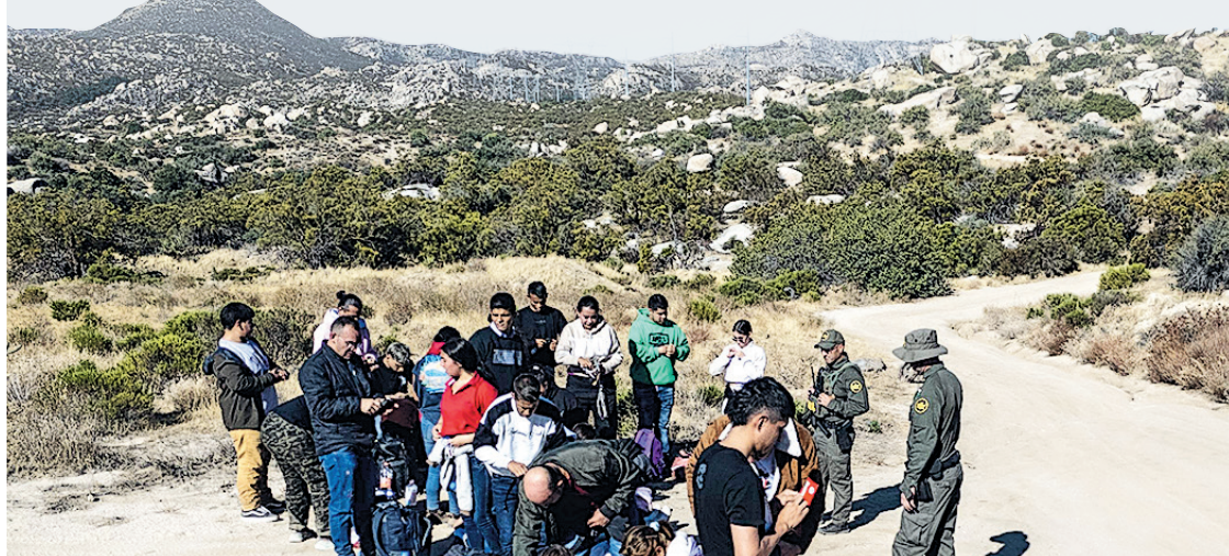
在美國加州哈巴溫泉鎮附近，邊境巡邏隊上月22日將一批從墨西哥越境進入美國的哥倫比亞尋庇者聚集一起。