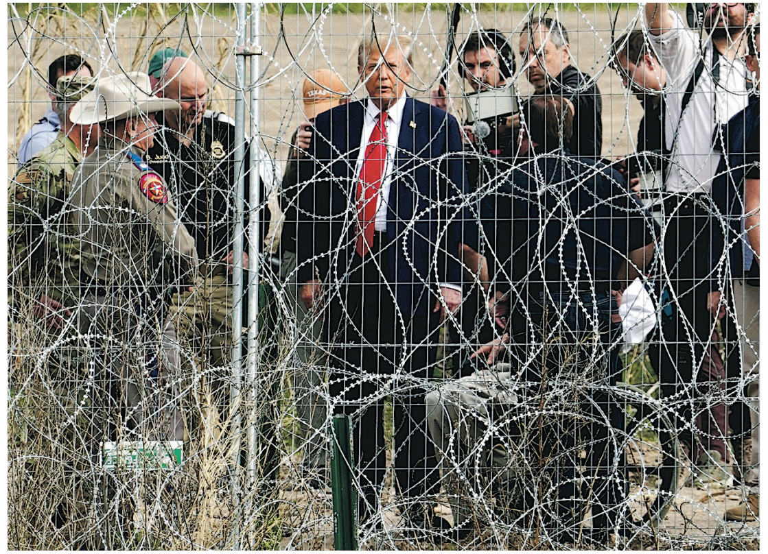
共和黨總統候選人特朗普今年2月得到州伊格爾帕斯的美墨邊境視察。