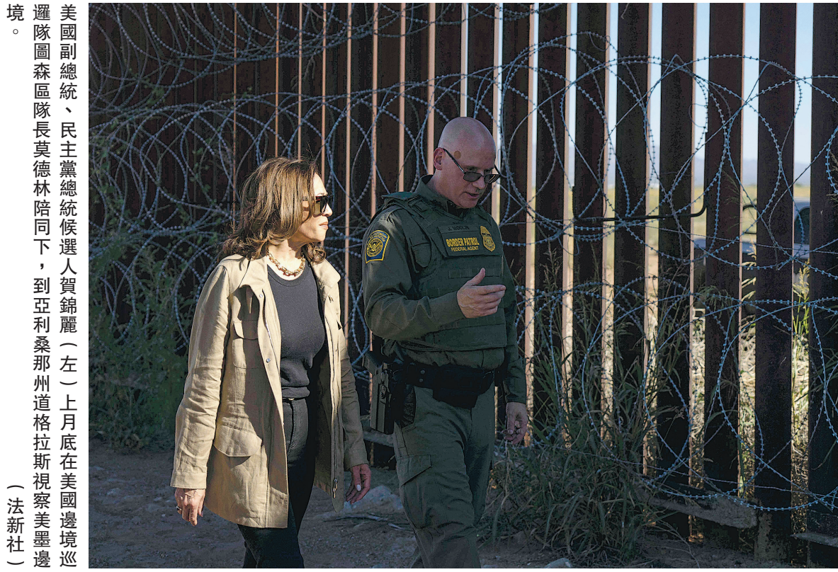
美國副總統、民主黨總統候選人賀錦麗（左）上月底在美國邊境巡邏隊圖森區隊長莫德林陪同下，到亞利桑那州道格拉斯視察美墨邊境。