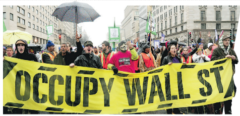
2011年12月7日，「佔領」運動示威者封鎖華盛頓K街。