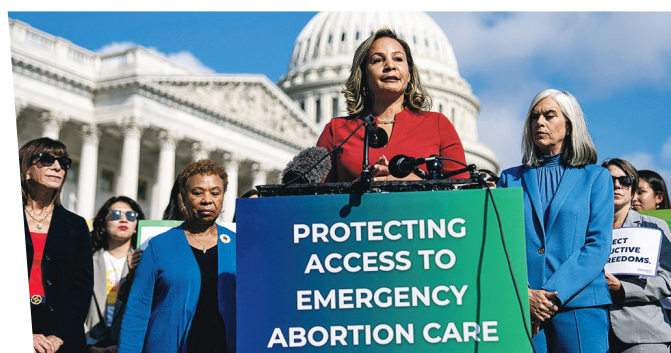
今年9月12日，美國眾議院民主黨人在國會說明支持緊急墮胎醫療的立場。

2022年最高法院推翻了1970年代的「羅訴韋德」案（Roe v. Wade）判決，將美國女性墮胎權的決定權交還州政府和議會，這對宗教保守派而言是重大勝利，但自由派則哀嘆女性自主被抹煞，自此女性墮胎權再次成為選戰焦點，或有助賀錦麗爭取更多女性選票。