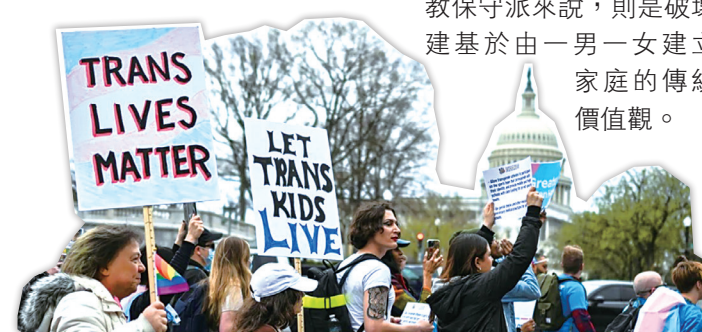
2023年3月31日，美國首都華盛頓有性小眾維權示威。

另一爭議焦點在「性小眾」（非異性戀者），其定義由最初的光顧（女/男同性戀、雙性戀和跨性別），到後來可加入Q（酷兒）、I（雙重身體性徵者）、A（無性戀者）等；對進步派而言，接納不同性別認同或性傾向代表社會邁向更平等，但對宗教保守派來說，則是破壞建基於由一男一女建立家庭的傳統價值觀。