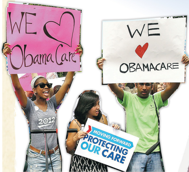
圖為奧巴馬醫保支持者。奧巴馬當政時提倡的醫改政策，強制要求全美人民購買醫療保險，扭轉小政府思維。