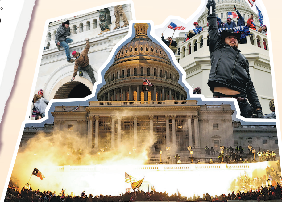
2021年1月6日，特朗普支持者為了阻止確認拜登當選的程序，衝擊國會山莊。

主流輿論認為這是美國民主的黑暗一天，也反映自特朗普在政壇得勢以來假資訊滿天飛的負面影響，惟特朗普和部分共和黨人堅持「竊取選舉」指控——有保守派人士甚至醞釀新執政藍圖，聲言要剷除政治建制，代表例子便是智庫傳統基金會發表的爭議性「2025項目」。