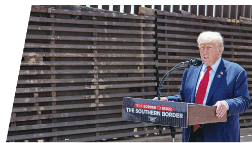
特朗普今年8月22日在亞利桑那州的美墨邊境發表政綱。

今屆大選其最受注目的議題，特朗普2016年當選時其主打議題，便是在美墨邊境興建新圍牆打擊人蛇偷渡，得州去年底更不惜「州門聯邦」，通過以遣返非法移民為重點的SB4法案，而在民意所向，拜登政府在選舉前夕任內也加強打擊邊境偷渡的濫用庇護申請問題，無論是特朗普、拜登或後來代其上陣的賀錦麗都不時到美墨邊境視察展示重視。